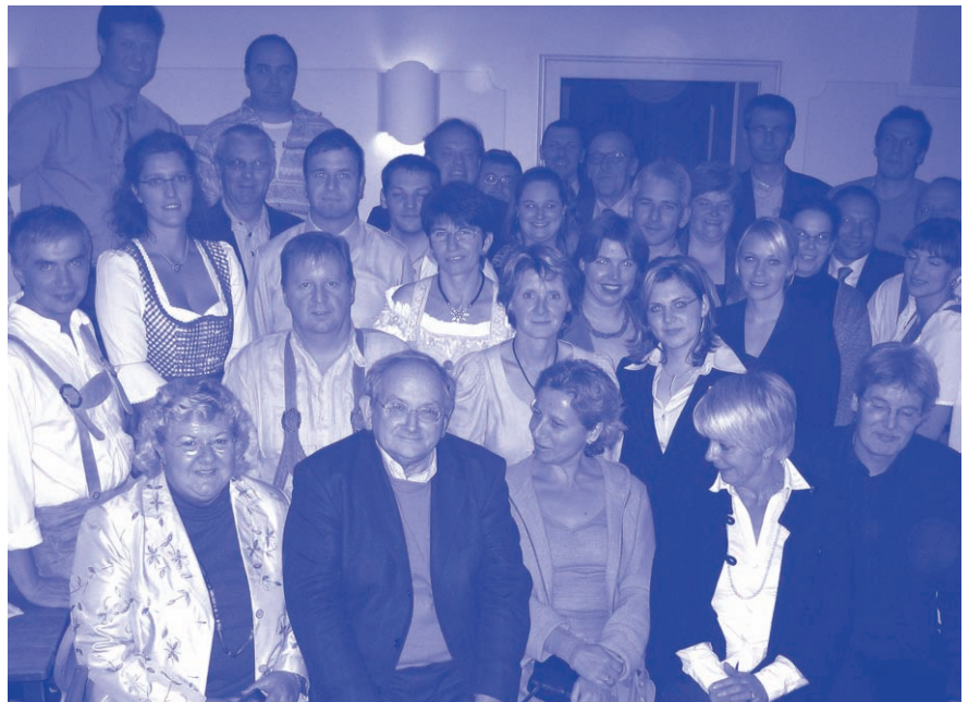
55 NEUE BERUFSPÄDAGOGINNEN VERBESSERN DIE PRAXIS DER AUS- UND WEITERBILDUNG. TEILNEHERINNEN UND DOZENTINNEN BEI DER ABSCHLUSSFEIER

Insgesamt haben innerhalb des Pilotprojektes 55 Berufspädagoginnen und Berufspädagogen ihren IHK-Abschluss gemacht und stehen damit ab sofort mit modernstem pädagogischem Methodenwissen ihren Mann oder ihre Frau. Damit geht eine erhebliche Qualitätssteigerung der betrieblichen Ausbildung einher, die den stark gestiege-