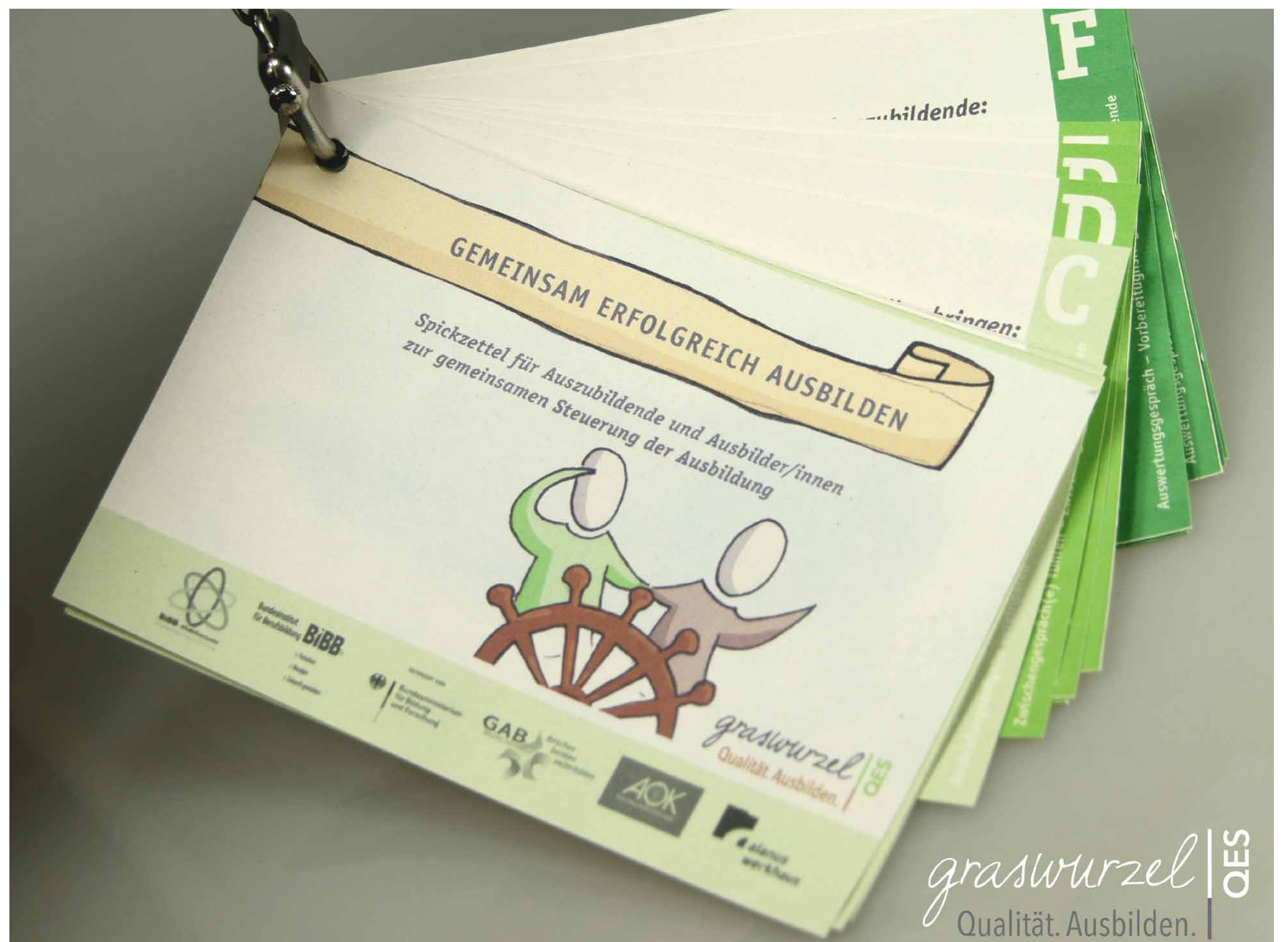
„Spickzettel“ für Ausbildende, ausbildende Fachkräfte und Auszubildende